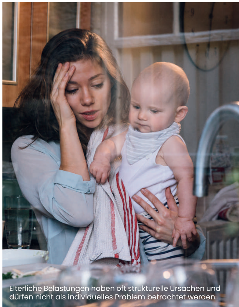
Elterliche Belastungen haben oft strukturelle Ursachen und dürfen nicht als individuelles Problem betrachtet werden.

Dieses Projekt ist ein wichtiger Schritt auf dem Weg dahin. Elterliche Belastungen haben oft strukturelle Ursachen und dürfen nicht als individuelles Problem betrachtet werden.