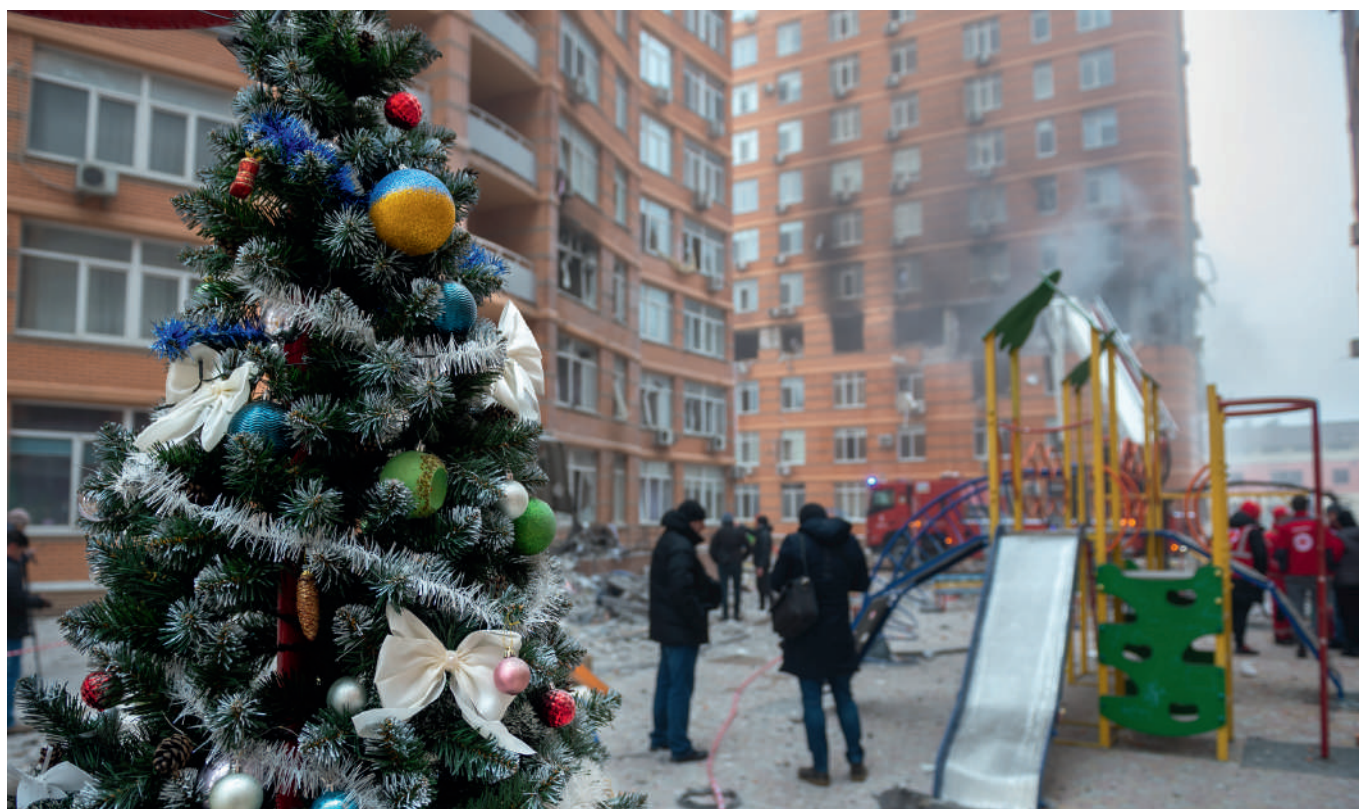
Russische Drohnen machen selbst vor Orten nicht halt, an denen sich Kinder aufhalten.

Bereits bestehende Studien zu diesem Ansatz zeigen positive Ergebnisse: Stress- und Angstsymptome reduzieren sich, Schlafprobleme bessern sich.