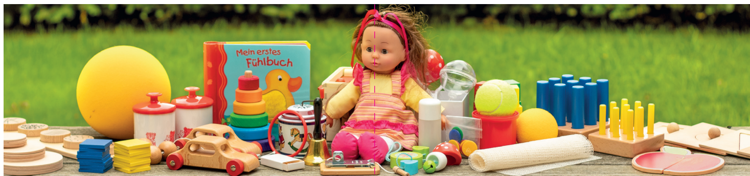
Materialsatz der Komplexversion der MFED 1-4

Die Münchener Funktionelle Entwicklungsdiagnostik (MFED 1-4) Komplexversion ist ein mehrdimensionales entwicklungsdiagnostisches Verfahren zur umfassenden Beurteilung der kindlichen Entwicklung in den ersten vier Lebensjahren. Die MFED 1-4 ist die Nachfolgerin der „MFED für das erste Lebensjahr“ sowie der „MFED für das zweite und dritte Lebensjahr“. Das Verfahren wurde im Vergleich zu den Vorgängerversionen systematisch neu bearbeitet und neu normiert. Dies schließt umfangreiche Änderungen am Testkonzept und den Aufgaben sowie eine Erweiterung des Altersbereichs auf das erste bis vierte Lebensjahr ein. Die MFED 1-4 erfasst die gleichen Entwicklungsbereiche wie die Vorgängerversionen, der Entwicklungsstand wird aber auf andere Weise bestimmt: Das Stufenleitermodell der Vorgängerversionen zur Abschätzung des Entwicklungsalters